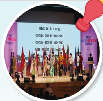
15개국의 국기가 행진하고

매년 5월 20일 세계인의 날을 기념하여 개최한 화성시 세계문화 축제에 여러분들을 초대합니다.