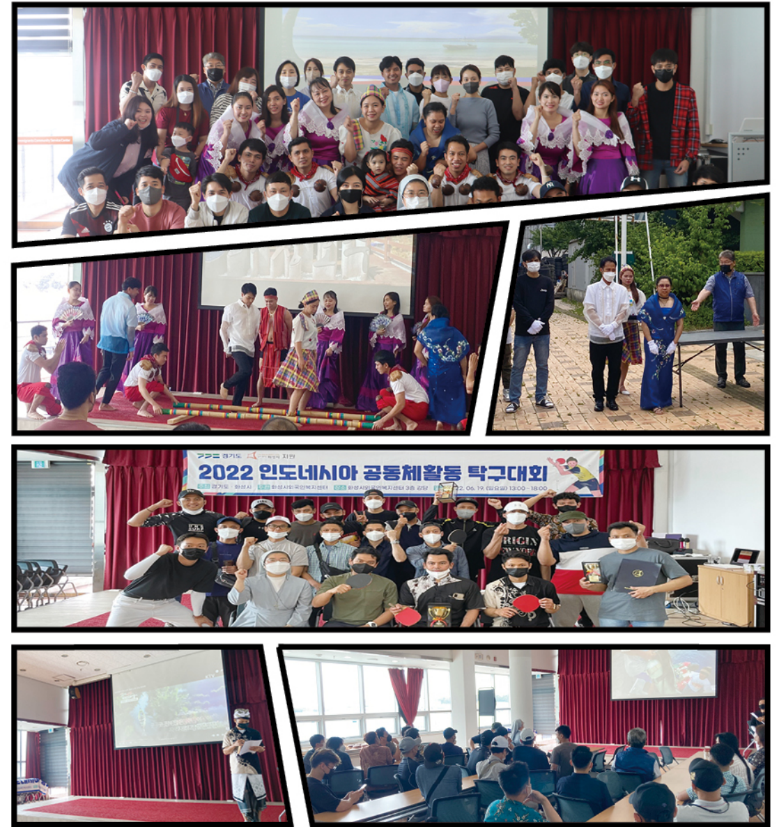
#필리핀 문화공연 #국기게양식 #인도네시아 탁구대회 #문화소개