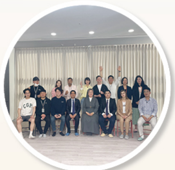
세계인의 날 기념 talk 투게더