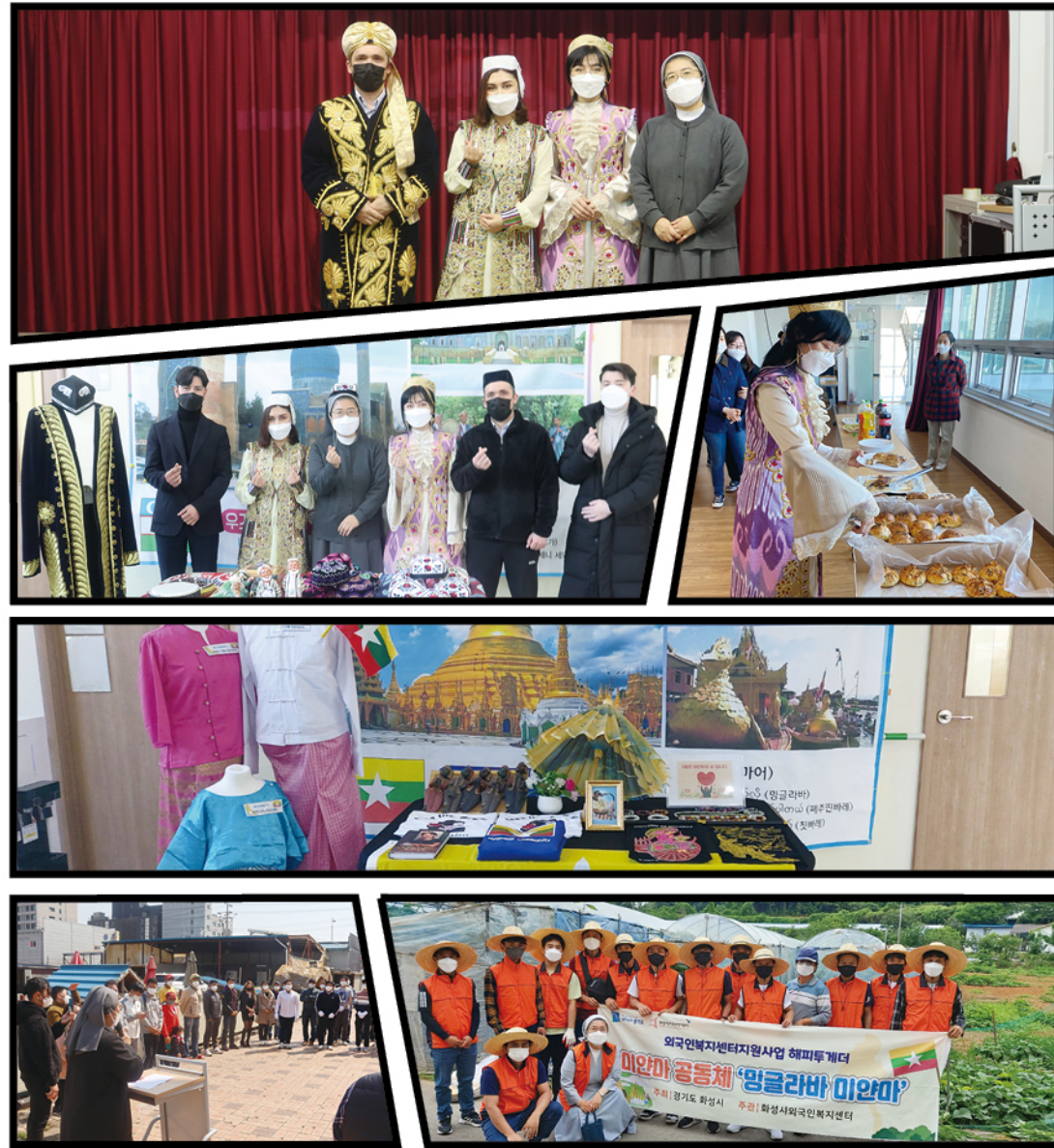
#우즈베크 문화공연 #전통음식 소개 #국기게양식 #미얀마 농촌 봉사활동