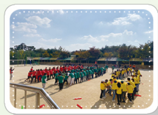
05 공 굴리기