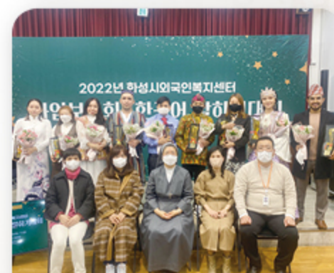
말하기대회 참여자 단체사진 촬영