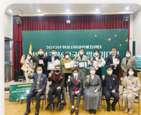
사업보고회 단체사진 촬영