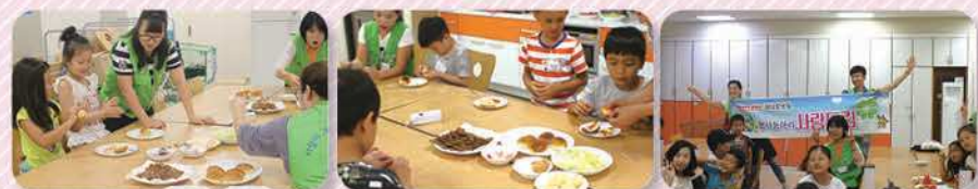
중도입국자녀들과 함께하는 체험활동 시간! 쿠키, 머핀 등을 함께 만들어 행복한 시간을 보냈습니다.

외국인 여러분께 한걸음 다가가는 봉사활동! 인도네시아 공동체와 함께 인도네시아 음식을 만들고 여러 이웃들과 나누었습니다.^^