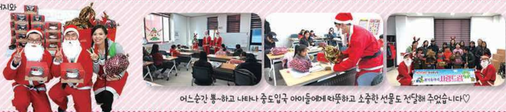
어느순간 뽐~하고 나타난 중도입국 아이들에게 따뜻하고 소중한 선물도 전달해 주었습니다♡

홈플러스 화성향남점 '사랑 드림' 봉사동아리가 보내주신 사랑에 깊이 감사드립니다.