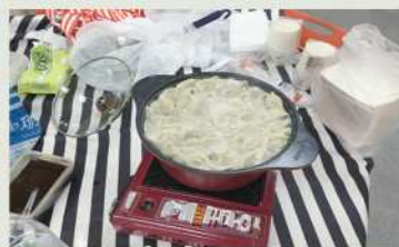
중국문화에 요리가 빠질 수 없죠! 중국식 만두입니다~ 골짜!

중국공동체는 작년에 이어 2년째 지역주민들을 대상으로 중국문화교류활동, ‘중국어캠프’를 이어가고 있습니다. 지역 주민들에게 올바른 중국문화를 알리고 중국에 대해 올바른 인식을 갖게 하고자 노력을 기울이고 있는 화성시외국인복지센터 중국 공동체! 새해에도 멋진 활동 기대해 주세요~