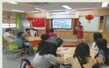
타자하오~(大家好) 중국어를 배워보아요~

중국공동체가 직접 자국문화를 전하는 문화교류활동, ‘중국어캠프’가 2일동안 향남중학교 학생들과 함께 했습니다. 중국어 인사말, 중국어 표현, 덕담 써보기, 중국 음식체험 등 다양한 활동을 통해 중국문화를 함께 교류하는 의미 있는 시간이 되었는데요, 참여하는 학생들도 처음 접하는 중국어가 다소 생소하고 어려웠지만, 곧잘 따라하며 흥미를 붙여 나갔습니다.