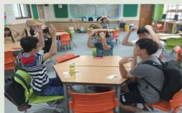
중국어 배워가자! 열친구와 즐거운 인사~ 뭐 아이 나~ (我愛你)