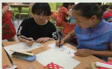
좋은 뜻을 담고 있는 중국어도 써보는 시간~