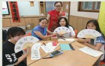
나만의 중국어 부채 완성!