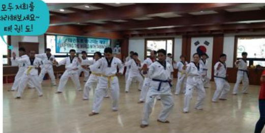
일요일 오후 우렁찬 기합소리가 체육관을 가득 매웁니다