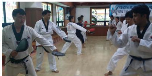
발차기, 겨루기, 품새연습을 통해 정신수양과 건강 모두 챙겨가요!